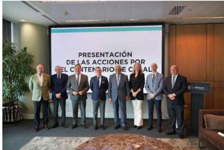
Autocares Casal ha presentado su logo y el calendario de actos para su centenario, que se conmemora en 2027.