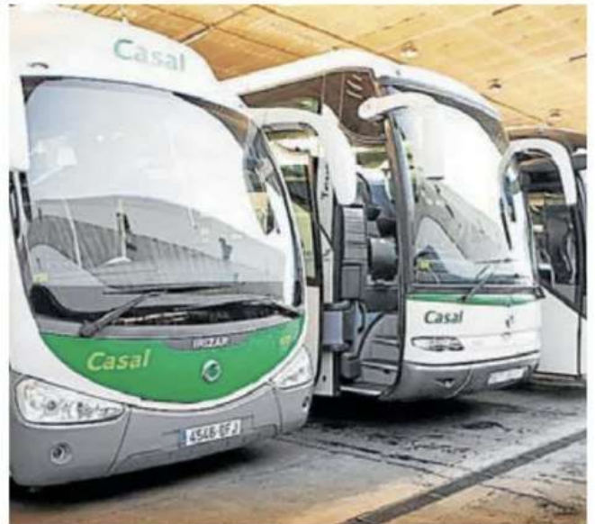
Flota de autocares Casal en las instalaciones de la empresa.