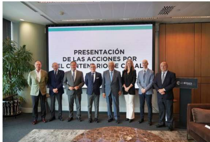
Autocares Casal ha presentado su logo y el calendario de actos para su centenario, que se conmemora en 2027.