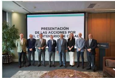
Autocares Casal ha presentado su logo y el calendario de actos para su centenario, que se conmemora en 2027.