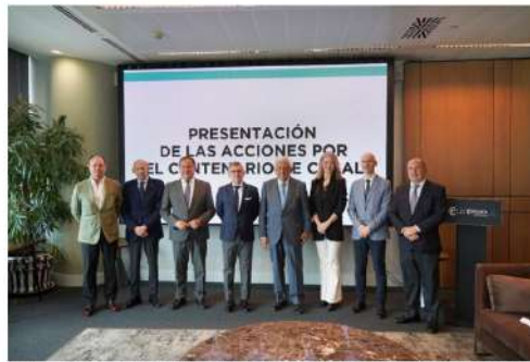
Autocares Casal ha presentado su logo y el calendario de actos para su centenario, que se conmemora en 2027.