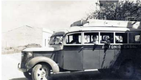
Uno de los autobuses de los orígenes de la empresa Casal

↳ Sevilla impulsa el Centro Aníbal González en el Pabellón Real con un innovador proyecto museográfico