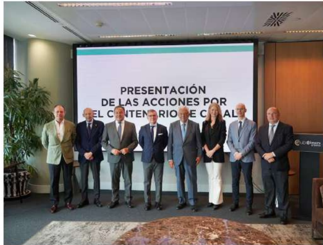
Presentación del logo conmemorativo y las actividades del centenario de la empresa Casal en la Cámara de Comercio de Sevilla

La compañía sevillana ha presentado su logo conmemorativo y un amplio programa de actividades